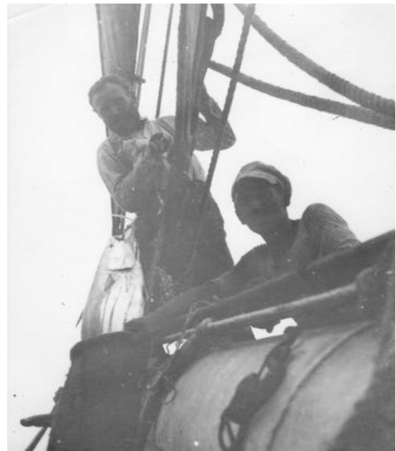
Comme la vitesse de ces voiliers est en moyenne 5 nœuds, en laissant trainer des lignes on pêche des poissons qui amélioreront l'ordinaire.

Vendredi 1 er septembre : Nous voilà en septembre, comme le temps passe vite, et comme on le trouve long à passer. Heureusement nous avons un temps splendide. Quelques grains de temps en temps. Je pense que nous allons attraper les alizés de SE, ce sont des vents permanents qui vont jusqu'à l'autre côté de l'Équateur, c'est du bon vent assuré pour 10 jours.