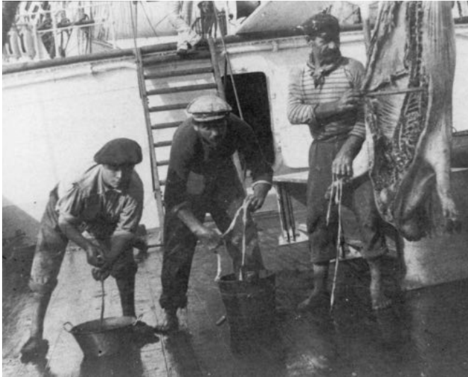
Ce ne sont pas des charcutiers, ce sont des marins !

Le Second reste couché, le Capitaine fait le quart avec le Lieutenant et moi. Le Maître d'équipage fait son quart tout seul. Le Second s'est purgé ce matin, il a pris trois cuillerées à soupe d'huile de ricin, et cela ne lui a rien fait, on a bien rigolé. On nettoie la cale, on va toute la repeindre au minium. On va devoir en reprendre pour un bon mois.